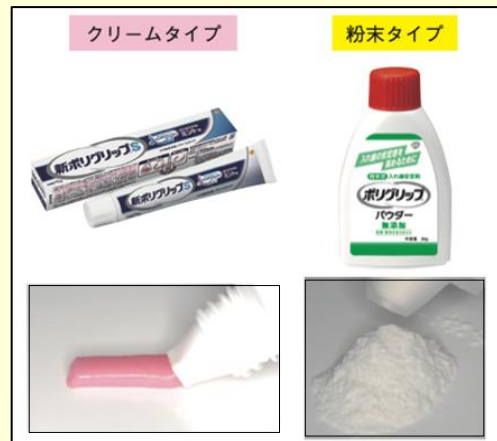
粉末タイプの使い方

クリームタイプ は、入れ歯を水洗いして水分を取り、入れ歯の裏側に小豆ほどの大きさで3箇所くらい間隔を開けて塗布し、口をすすいでから、入れ歯を入れて1分間噛みます。 粉末タイプ は、入れ歯を濡らしてから安定剤を振りかけてから、入れ歯を軽く叩いて余分な安定剤を振り落としてから入れ歯を入れて噛みます。いずれも入れ歯を手入れする際には、入れ歯用ブラシでしっかり取り除いてください。この2つは、薄くつけると入れ歯が安定し、つけすぎると口に中に残ってしまい入れ歯を不安定にします。クッションタイプは、安定する反面、材質が硬く均一に広がらず、かみ合わせに悪影響を及ぼしやすいため多くの先生は推奨していません。